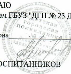
ГРАФИК ПРОФИЛАКТИЧЕСКИХ ОСМОТРОВ УЧАЩИХСЯ И ВОСПИТАННИКОВ Школы № 508 На 2020г.