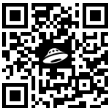
Двигательный режим обций