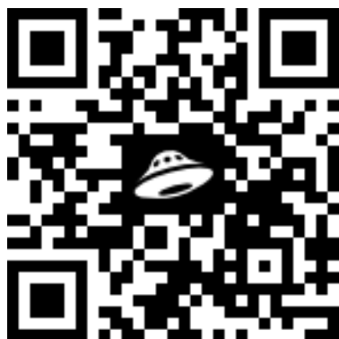
Гимнастика пробуждения по возрастам