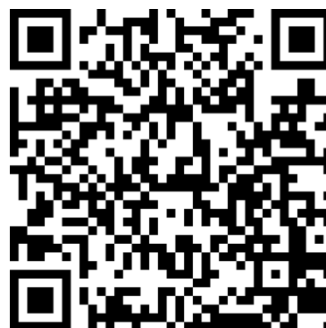
Материалы к занятию «В гостях у трех поросят» - конспект/презентация