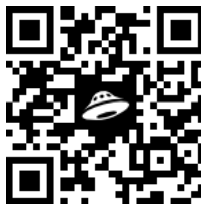
Материалы секции 2