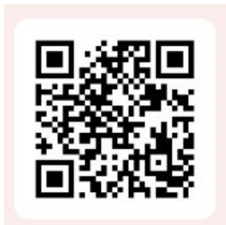
Материалы секции 1